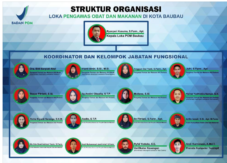
Gambar 1. Struktur Organisasi Loka POM di Kota Baubau

Struktur Organisasi Loka POM di Kota Baubau terdiri atas Kepala dan Kelompok Jabatan Fungsional. Dalam melaksanakan tugasnya, Loka Pengawas Obat dan Makanan di Kota Baubau berkoordinasi dengan Balai Pengawas Obat dan Makanan di Kendari yang bertujuan untuk meningkatkan efektivitas dan efisiensi pelaksanaan tugas dan fungsi Loka POM di Kota Baubau.